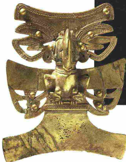
Sopra, Venere , cultura Chupícuaro (400-100 a. C.). A sinistra, Pendente , cultura Tainona (800 - 1300 d. C.).